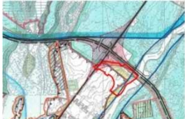
WYRYS ZE ZMIANY STUDIUM UMIAROWIENIA I KIERUNKÓW ZAGOSPODAROWANIA PRZESTRZENNEGO MIASTA PIŁY